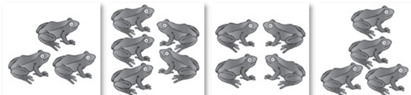
Afbeelding 3. Kijk, hier zie je een aantal plaatjes. Op welk plaatje staan de minste kikkers? Zet een streep onder dat plaatje.

Bij dit onderdeel gaat het om de structuur van de telrij, vanuit verschillende getallen kunnen tellen en terugtellen. Omgaan met hoeveelheden gaat over het omgaan met hoeveelheden tot tenminste tien: vergelijken en ordenen op meer, minder, evenveel, meeste en minste (zie afbeelding 3). Het herkennen van kleine getalpatronen door patronen en structuren te gebruiken hoort hier ook bij. Bij omgaan met getallen gaat het over cijfersymbolen en de verschillende betekenissen van getallen.