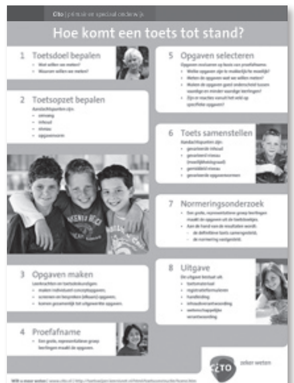
Afbeelding 6. Hoe komt een toets tot stand?