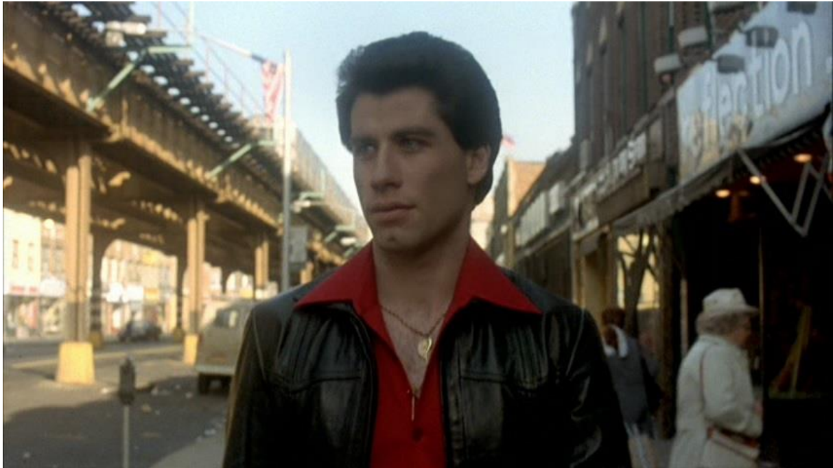
John Travolta in Saturday Night Fever

Kandidaten en docenten vonden het examen kunst havo van 2017 'goed te doen', de onderwerpen werden over het algemeen leuk en interessant gevonden. Echt enthousiast waren kandidaten over de clip Run The World, Girls van Beyoncé en over het fragment uit de openingsscène van Saturday Night Fever met John Travolta. Dit fragment hoorde bij het vragenblok over de ontwikkeling van dancemuziek. Daarin kwamen verschillende disco- en danceklassiekers aan bod, zoals Chics Dance, Dance, Dance , Pump Up the Volume van MIAIRIRIS en Poing van de Rotterdam Termination Source; een reeks vragen die kandidaten meedeinend beantwoordden.