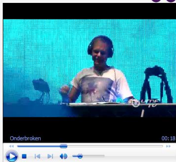
Armin van Buuren live tijdens het Ultra Music Festival Miami , 2015

In de eenentwintigste eeuw werd de dancecultuur steeds meer een onderdeel van de mainstreamcultuur. In Nederland ontstond een bloeiende dj-cultuur en dj's als Tiësto, Armin van Buuren en Hardwell stonden in de jaren tussen 2002 en 2014 diverse keren aan de top van de wereldranglijst van 'beste dj'. In filmfragment 4 zie je een deel van een optreden van Armin van Buuren.